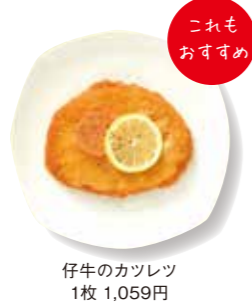
仔牛のカツレット 1枚 1,059円

☎03-5361-1111 ㊿10:00~20:00(金・土は20:30まで) MAP P.10-11 C-4