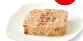
パテ ドカンパーニュ 100g 519円

☎03-3342-1111 ㊿10:00~20:30(日・祝は20:00まで) MAP P.10-11 C-3