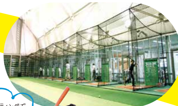
ドーム型の天井は開放感ばつぐん