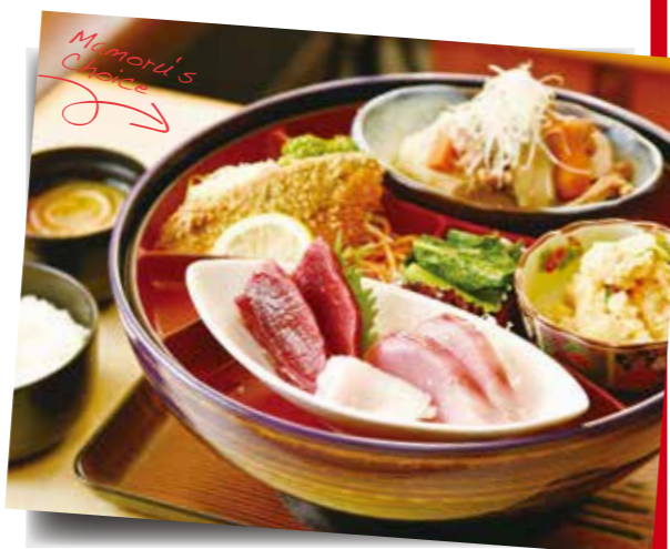
日替わり盛り合わせ弁当 980円