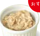
ココット入りボークリエット 1個 594円

☎03-3342-1111 ㊿10:00~20:30(日・祝は20:00まで) MAP P.10-11 C-3