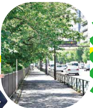
MAP P.14-15 C-3