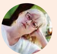
能町みね子 漫画家兼エッセイスト、イラストレーター。新宿区神楽坂在住。最新刊「能サボ」「能スポ」「きまぐれミルクセーキ」発売中。ラジオ・テレビ番組への出演多数。

神楽坂IIオシャレで高級、という イメージを、周縁部の住民としては ぜひぶち壊したい。