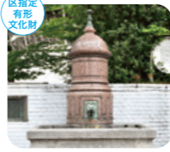
馬水槽 新宿3-23 JR新宿駅東口広場

明治期の新宿御苑に建てられたモダンな休憩施設。国賓を迎えた晩餐会なども催されたといわれる。[MAP P.10-11] D-4 ※酒類持込禁止、遊具類使用禁止