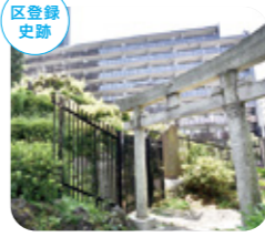
成子天神社の富士塚 西新宿8-14-10

江戸後期の文化年間に安置されたといわれる閻魔大王像。高さ約5mで都内最大の閻魔様。「内藤新宿の閻魔」として信仰を集めてきた。[MAP P.10-11] D-3