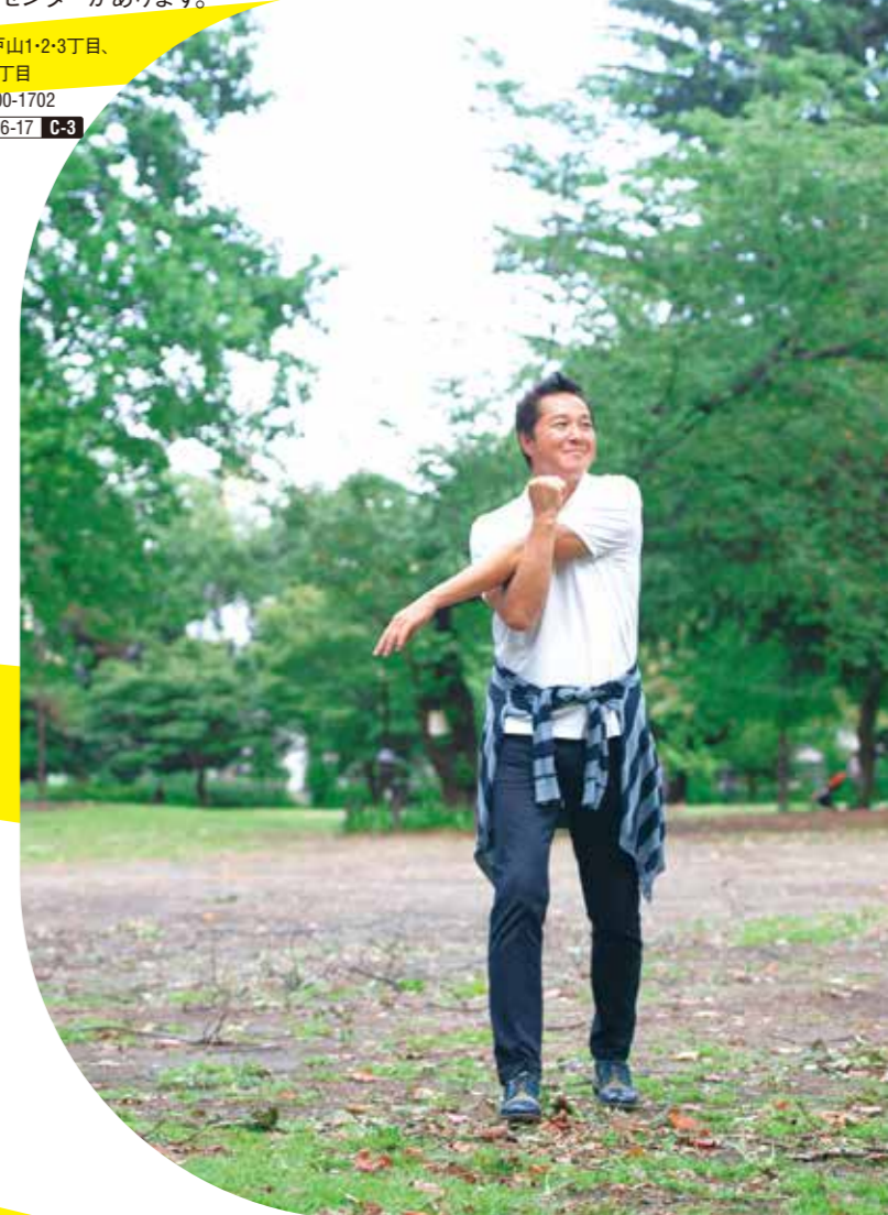
園内にはいくつもの広場が点在