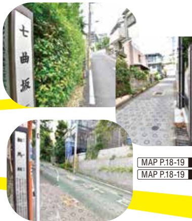
MAP P.18-19 C-3 MAP P.18-19 D-3

落合は言わずと知れた坂の街。長さや斜度の異なるさまざまな坂があります。坂に付けられた名前もユニークなので、ぜひ注目を。