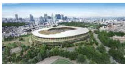
大成建設・梓設計・隈研吾建築都市設計事務所JV作成