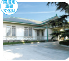
新宿御苑旧洋館御休所 新宿区内藤町11

明治期の新宿御苑に建てられたモダンな休憩施設。国賓を迎えた晩餐会なども催されたといわれる。[MAP P.10-11] D-4 ※酒類持込禁止、遊具類使用禁止