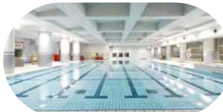
1年通して利用できる、室内温水プール