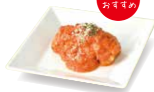
白身魚のチーズソース巻き オマール海老のトマトクリームソース 1個 454円

☎03-3352-1111 ㊿10:30~20:00 MAP P.10-11 D-3