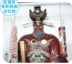
太宗寺の閻魔大王像 新宿2-9-2

明治期にロンドン水槽協會より寄贈。馬用の水槽で、人間や小動物用の水飲みもついている。[MAP P.10-11] C-3