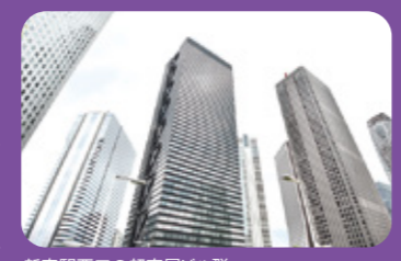
新宿駅西口の超高層ビル群