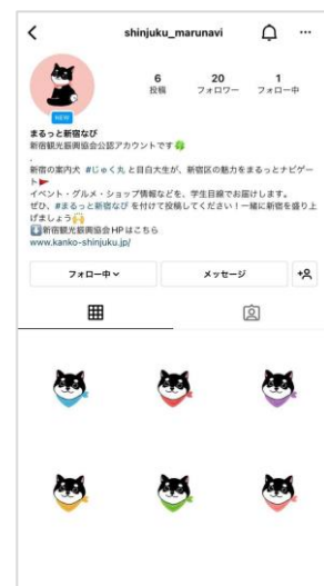
Instagram「まるっと新宿ナビ」