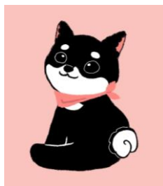
まるっと新宿ナビ「じゅく丸」