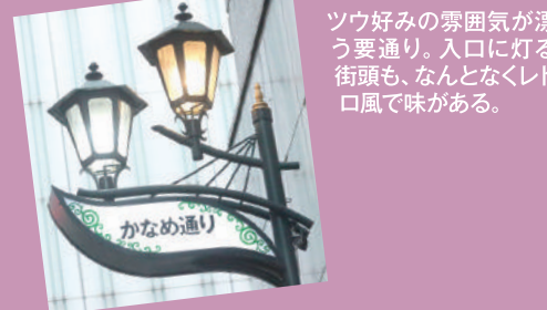
ツウ好みの雰囲気か漂う要通り。入口に灯る街頭も、なんとなくレトロ風で味がある。

末広通りのシンボルと言えば、なんといっても「新宿末廣亭」。その趣ある寄席を中心に、新宿通りから靖国通りへ抜ける道におよそ100軒もの飲食店が並び、安定した賑わいをみせています。カジュアルな居酒屋や立ち飲み屋など地元客に愛されるお店から、イタリアンやアジア・エスニック料理などの専門店、ショッピング帰りに行きたいオシャレな雰囲気のレストランやバーなどジャンルも多様で、年配層から若い世代までお客さんの顔ぶれが豊かなのもこの通りの特徴です。