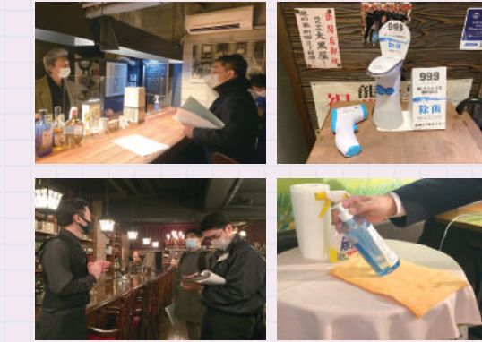
店舗訪問時の様子

新宿観光振興協会の職員と国立感染症研究所の専門家が一部店舗を訪問しました。清掃に使用している消毒剤の有効性や接客時の飛沫感染などの対策について、店舗に合った方法や継続すべきポイントなどを一緒に考えました。