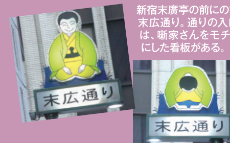
新宿末廣亭の前にのびる末広通り。通りの入口には、断家さんをモチーフにした看板がある。