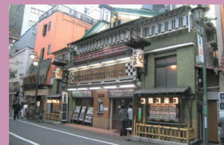
写真上:新宿通り沿い、写真下:新宿末廣亭

今回の安心情報マップの対象は「新宿三丁目駅」(都営地下鉄、東京メトロ丸ノ内線・副都心線)周辺のエリアです。新宿三丁目駅は、新宿駅から徒歩圏内(ひと駅)にあり、その周辺は、百貨店やファッションビル、大型書店、家電量販店などの商業施設、シネコン・映画館、寄席や劇場などの娯楽施設が集まる、都内屈指のエンターテインメントスポットです。都内のみならず国内外から多くの買い物客・観光客が訪れ、老若男女、様々なニーズにこたえるべく、多種多様な飲食店が点在しているのも特徴です。味・サービスともにレベルが高いお店が多いのは、それぞれ切磋琢磨しながら日々腕を磨いているからかもしれません。