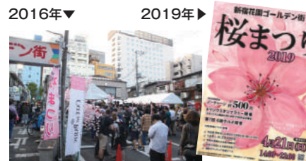
主催:新宿三光商店街振興組合

2013年より毎年4月に開催。2016年は開催5日前に街で火災が発生するも、復興に向けて前向きに実施。夏の納涼祭同様、参加全店チャージ無料、1杯500円。野外でのライブ企画も人気。