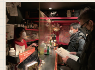
カウンター越しの接客では、ビニールカーテンを設置して飛沫を防止。