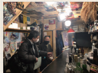
消毒液の設置や席の間引きなど、限られた空間でも有効な対策を各店で実施。