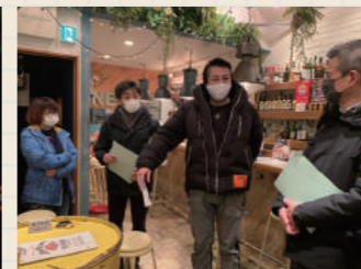
飛沫感染防止を意識した席の配置など具体的なアドバイスをいただいた。