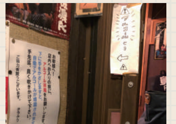
貼り紙などを用いてお客様に感染対策の協力を促す工夫をしているお店も。