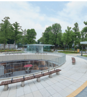
迎賓館赤坂離宮前休息場所

位於四谷站附近，是一個中間夾著林蔭道、左右對稱的三角形公園。以前，在綠色草坪旁邊有白色的柱子和噴泉等。沿著林蔭道前行，景色壯觀的迎賓館就映入眼簾。現在，公園內有配有咖啡廳、商店、無障礙衛生間等的迎賓館赤坂離宮前休息場所。