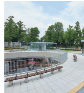
迎宾馆赤坂离宫前休息场所

位于四谷站附近，是一个中间夹着林荫道、左右对称的三角形公园。以前，在绿色草坪旁边有白色的柱子和喷泉等。沿着林荫道前行，景色壮观的迎宾馆就映入眼帘。现在，公园内有配有咖啡厅、商店、无障碍卫生间等的迎宾馆赤坂离宫前休息场所。