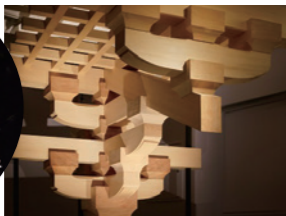
日本传统木造建筑博物馆