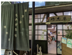
东京印染故事博物馆

用剪成小块的丝绸制作而成的发饰，称作发簪。东京染小纹和江户更纱在传统的基础上加入了现代元素日本建筑的传统技术-木造建筑。能感受到日本传统技术的三楼小型博物馆。还能参观和体验各种讲座。(要事先咨询)