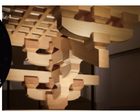
Museo de Kigumi

Museo de Tsumami-Kanzashi 📍 Hills Ishida 401, 4-23-28 Takadanobaba, Shinjuku-ku ☎ 03-3361-3083 🕒 10:00 - 17:00 🗓 Domingos, lunes, martes, jueves y viernes 🆓 Gratis 🚶 5 minutos andando desde la estación de Takadanobaba (líneas JR, Seibu y metro)