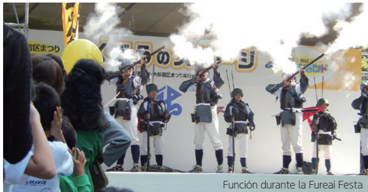
Función durante la Fureai Festa

Hace unos 400 años, Tokugawa Ieyasu trasladó la sede del Gobierno a Edo y, para proteger los confines occidentales del capitolio, desplegó 100 mosqueteros hasta allí. El lugar en el que estos mosqueteros vivían era conocido como Hyakunin-cho (la ciudad de los 100 mosqueteros). Estos mosqueteros rezaron en el santuario Kaichuinari, cuyo nombre proviene de estos mosqueteros también. Kaichu significa «acertar a todos los objetivos». Incluso a día de hoy, se pueden apreciar el arco sintoísta a la entrada que separa el mundo sagrado del profano, conocido como torii, los lavabos para que el visitante pueda purificarse con el agua, así como las linternas de los jardines ofrendados por los mosqueteros.