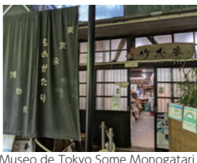
Museo de Tokyo Some Monogatari

Los tsumami kanzashi son adornos para el cabello, creados con pequeños trozos de seda. Los trabajos de teñido en Tokio (teñidos tipo Tokyo Some Komon y Edo Sarasa) han incorporado una sensibilidad moderna con estilo tradicional. Kigumi es una técnica tradicional utilizada en la arquitectura japonesa. Las obras y talleres de estos tres museos están abiertos al público. En estos, se puede experimentar de primera mano y aprender sus respectivos trabajos (se requiere realizar una consulta previa).