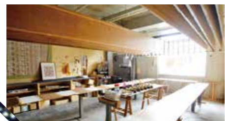
図案の作成から染色まで一貫して自社で行っています