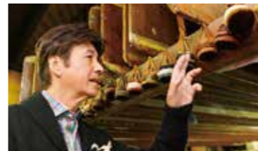
丸ハケなどの道具や、扉や天井といった工房そのものが歴史を感じさせます