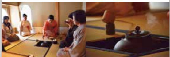
茶道教室では、本格的に茶道の作法を学ぶこともできます

全国各地で選り抜いた茶道具を販売する、創業85年のお店。2つの茶室を完備し、さまざまな茶事を開催しています。和のコンシェルジュが出張し、イベントのお手伝いもします。椅子に座って抹茶をいただける立礼席も行われ、初心者の方も気軽に茶道を体験できます。また、ギャラリーでは、月ごとの入れ替えで一流の茶道具の展示を見ることができます。