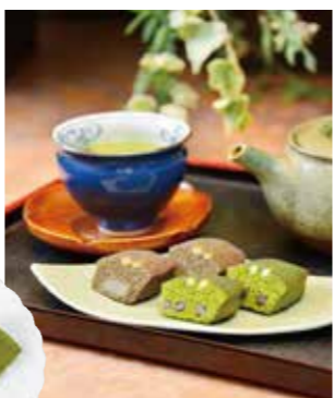
抹茶洋菓子詰合せ 2,376円

京都宇治産の抹茶をふんだんに使用したオリジナル抹茶洋菓子。抹茶の鮮やかな色と優しいほろ苦さ、ほど良い甘さは専門店ならではの