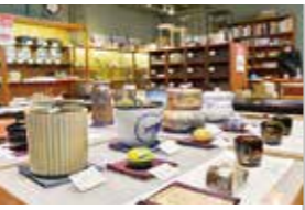
茶道具や和の小物なども種類豊富に取り扱っています