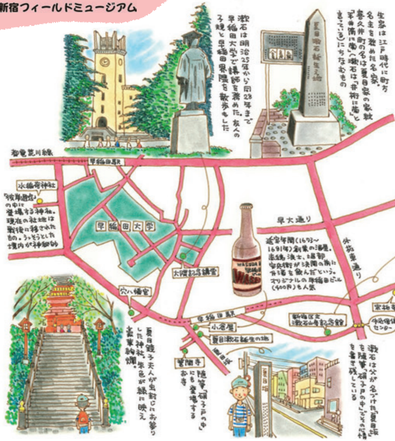
イラスト/ヨシダケン

生家は江戸時代に町方名主を勤めた名家。喜久井町の名は夏目家の家紋「五井筒」に由来。漱石は「井筒」に「石」を添えて「石」にちなむもの。