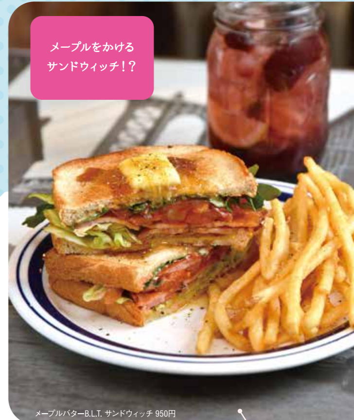
メープルバター-B.L.T. サンドウィッチ 950円