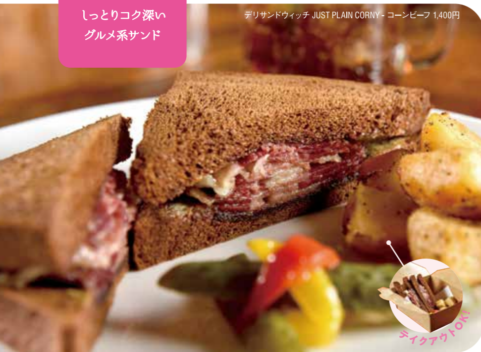
デリサンドウィッチ JUST PLAIN CORNY - コーンビーフ 1,400円