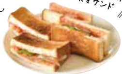
ナポリタンサンド 500円