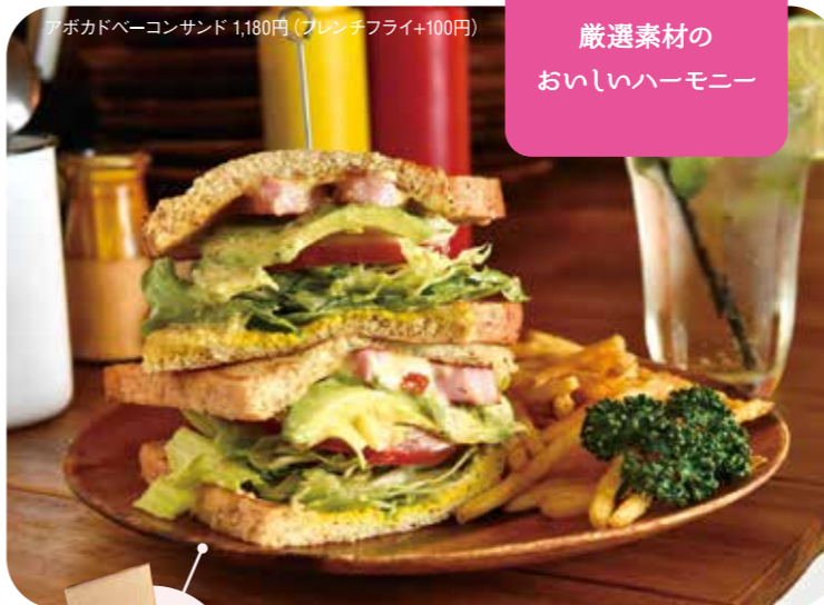
アボカドベーコンサンド 1,180円 (フレンチフライ+100円)