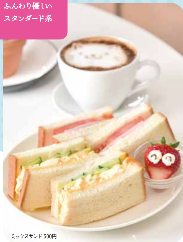
ミックスサンド 500円