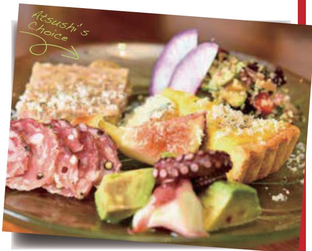
旬のおまかせ盛り合わせ 1,620円