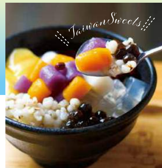
♡ 台湾スイーツ ♡ 特製芋園2号 850円

タロイモ、かぼちゃ、紫芋でできた3種類の餅に、あずき、ハトムギ、タピオカなどをトッピングした、無添加の手づくり台湾スイーツ。モチモチ&ひんやりがたまりません。