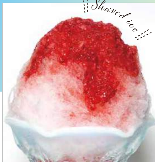
♡ かき氷 ♡ 氷いちご 1,026円 ※昨年販売価格により変動あり ※販売期間:夏季限定

名店自慢のかき氷は、完熟いちごの果肉がそのまま入った濃厚ソースが絶品。自然な甘さと氷の冷たさが溶け合うおいしさを、夏の新宿でぜひ体験してください。