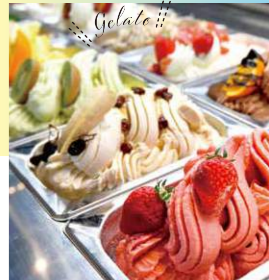
♡ ジェラート ♡ ジェラート2種類 500円

旬の食材を味わえるジェラートがずらり。砂糖を使っていないので、素材の甘みをそのまま楽しめます。注文を受けてから焼き上げるワッフルコーンも格別なおいしさです。