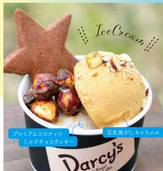
♡ アイスクリーム ♡ ハーフ&ハーフ with 2トッピング 600円

有機JAS認定のオーガニック豆乳とこだわりの卵で作ったアイスに、てんさい糖のキャラメリゼを添えて。気になる材料をカットしたギルト(罪悪感)フリーの傑作スイーツです。