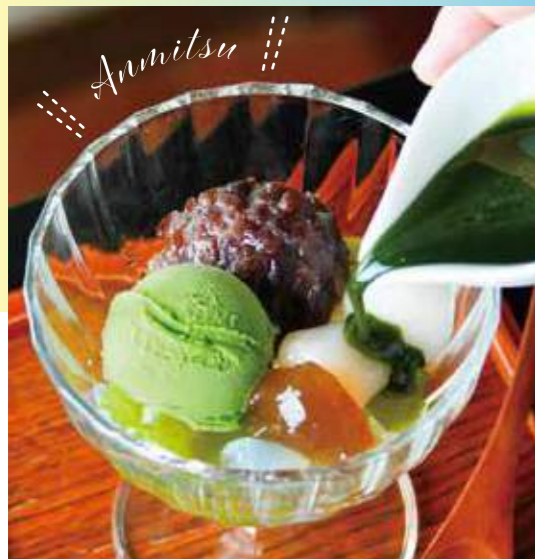
♡ 和スイーツ ♡ 抹茶クリームあんみつ 700円

有機栽培かつ無農薬の日本茶を楽しむカフェで、抹茶づくりのひんやりスイーツ。抹茶の寒天や抹茶のアイスクリームに、自家製の抹茶シロップをたっぷりかけて。